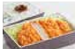
特ロースかつ弁当