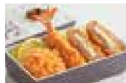
盛合せ弁当「からたち」 一口ひれかつ・海老フライ チーズ入りメンチかつ