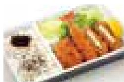
盛合せ弁当「からたち」 一口ひれかつ・海老フライ チーズ入りメンチかつ