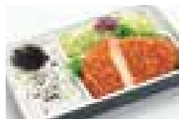
特ロースかつ弁当