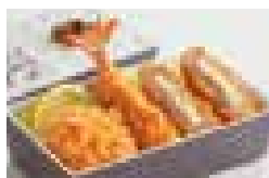
盛合せ弁当「からたち」 一口ひれかつ・海老フライ チーズ入りメンチかつ