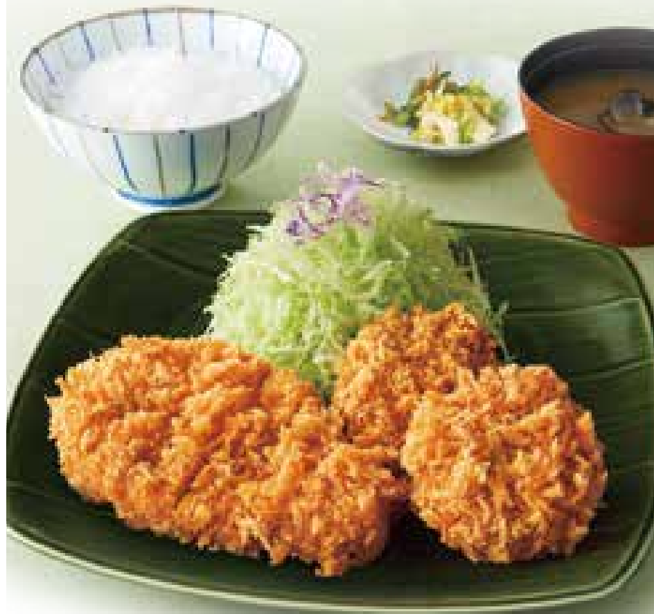
ひれロース盛合せ御飯 1,480円

当店では、小麦・乳成分・卵・甲殻類(えび・かにを 含む商品)と共通の器具・食材(パン粉・揚げ油等)を 使用しております。 アレルギー物質は係員までお問い合わせください。 ※表示価格は全て税込みです。 ※国産米を使用しております。 ※全ての定食に御飯、味噌汁、キャベツ、お新香が付きます。 ※盛付け、器は変更になる場合がございます。