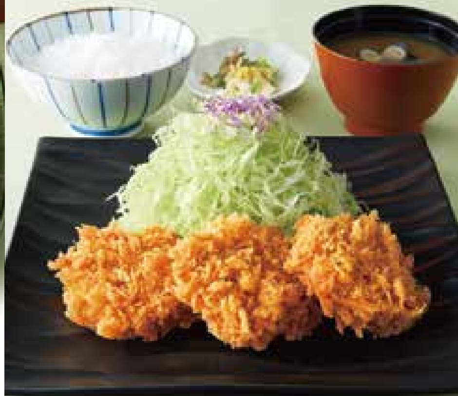
一口ひれかつ御飯 1,300円