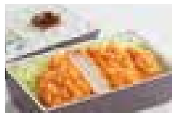
特ロースかつ弁当