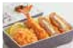
盛合せ弁当「からたち」