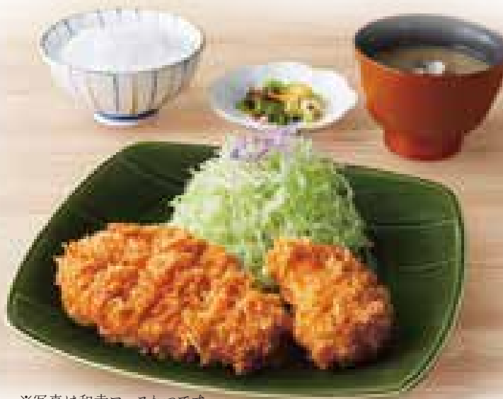
※写真は和幸ローズかつです。