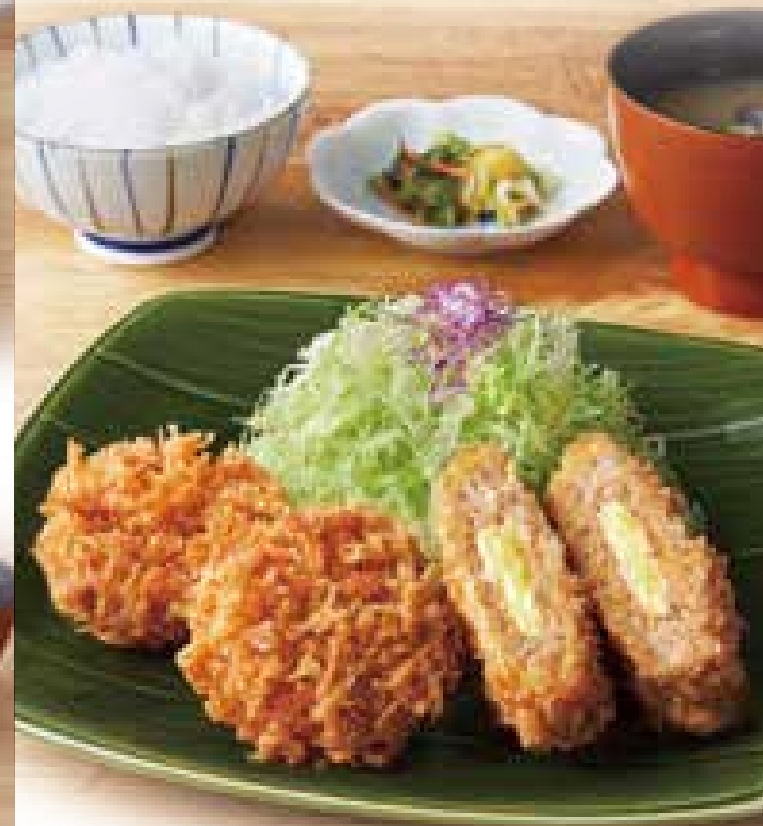
※写真は一口ひれかつ2ヶです。