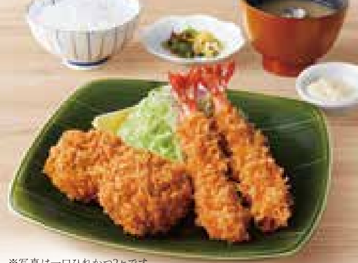
※写真は一口ひれかつ2ヶです。