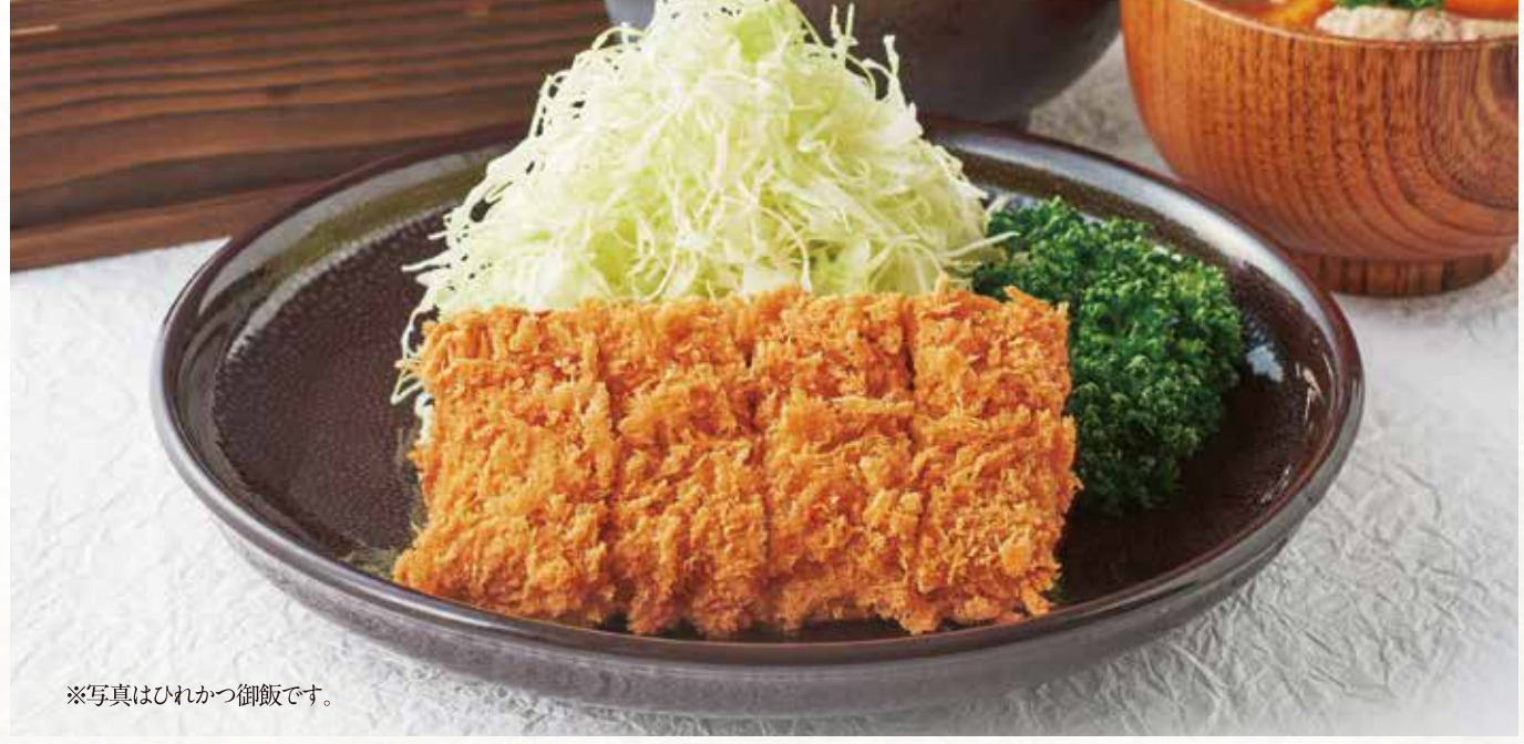
※写真はひれかつ御飯です。