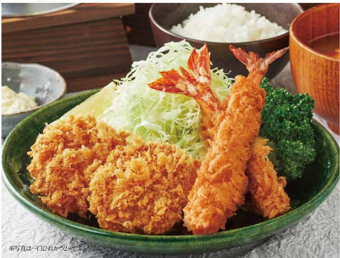
※写真は一口ひれかつ2ヶです。