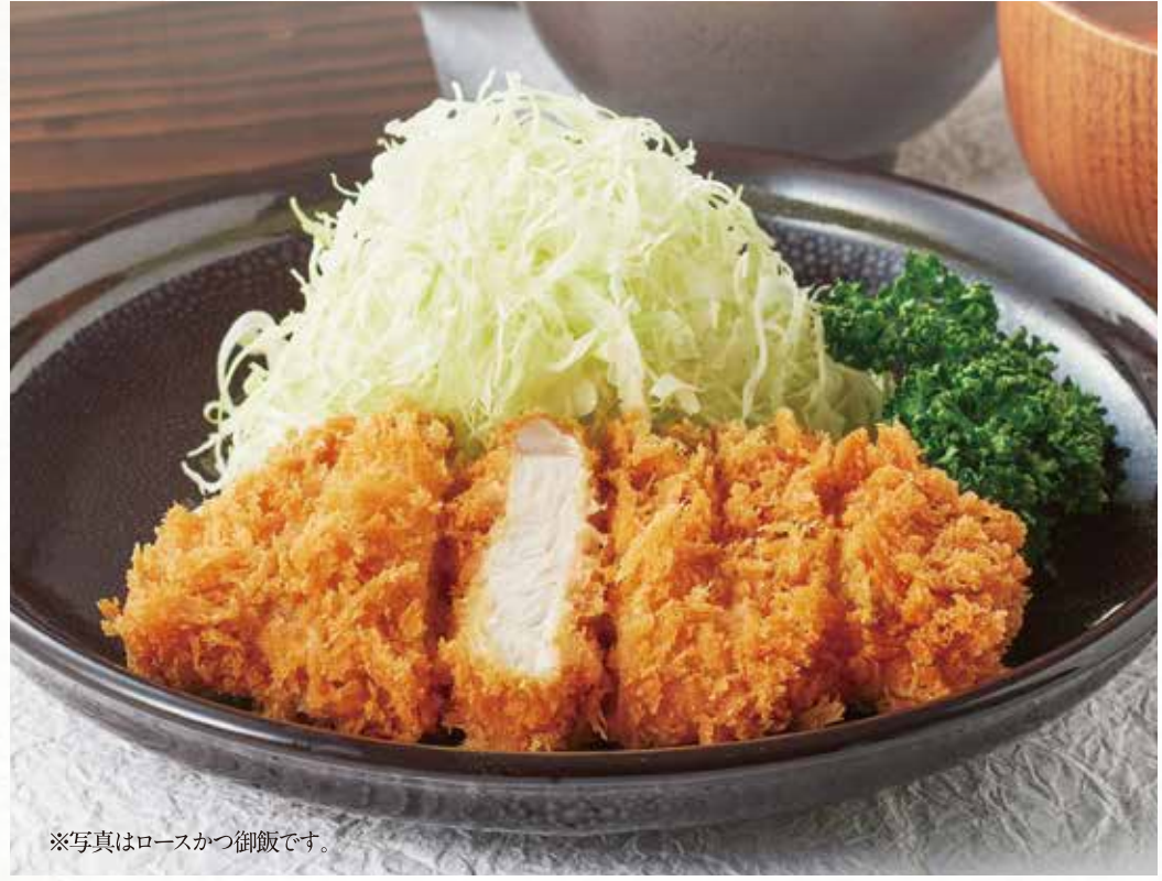
※写真はロースかつ御飯です。