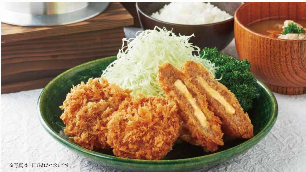
※写真は一口ひれかつ2ヶです。