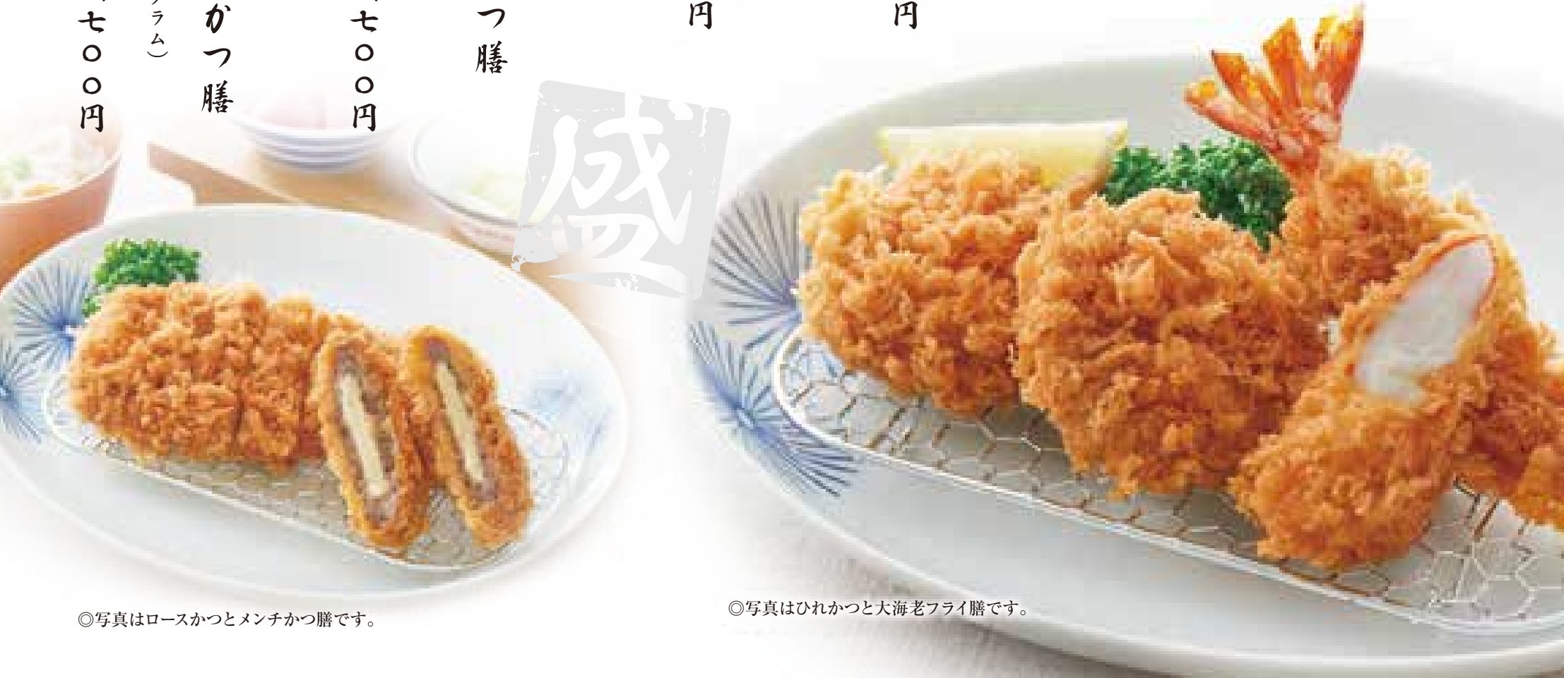
◎写真はロースかつとメンチかつ膳です。