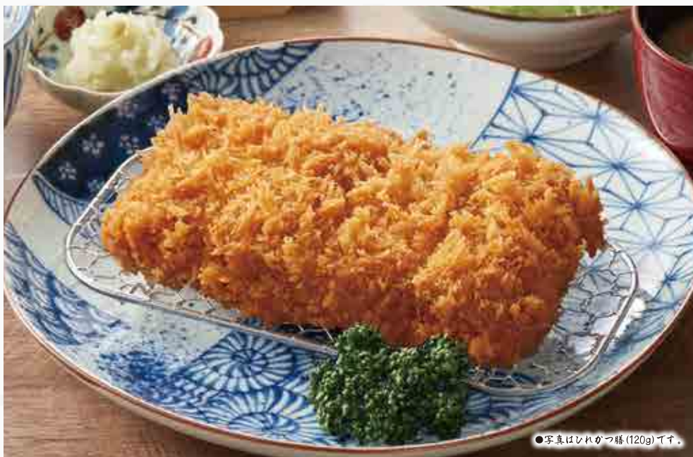
●写真はひれかつ膳(120g)です。

ひれ肉の中心部分を丸太のように一本揚げしました。 柔らかくジューシーな味わいをお楽しみください。