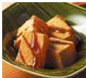
川崎大師 大谷堂 わらび餅 230円