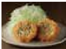
キャベツメンチかつ 300円