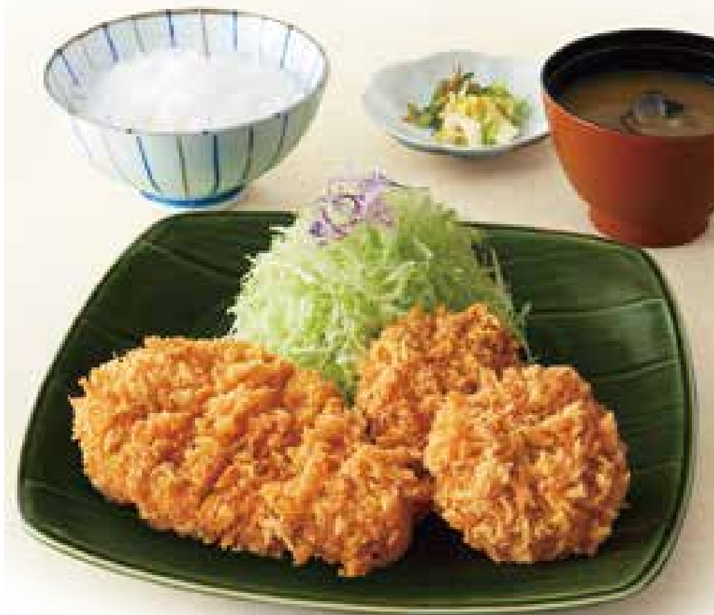
一口ひれかつ御飯 1,500円