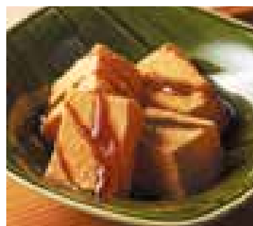
川崎大師 大谷堂 わらび餅 230円