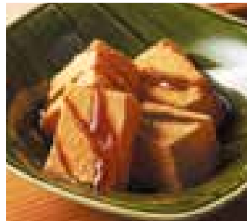
川崎大師 大谷堂 わらび餅 230円