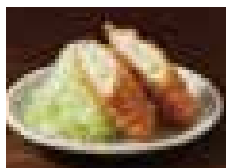
チーズ入りさみかつ 450円