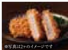
※写真は2ヶのイメージです 一口ひれかつ 420円