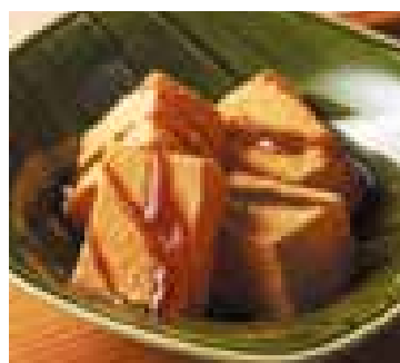
川崎大師 大谷堂 わらび餅 230円