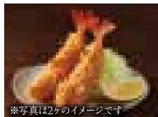
※写真は2ヶのイメージです 海老フライ 500円