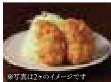
※写真は2ヶのイメージです カニクリームコロッケ 500円