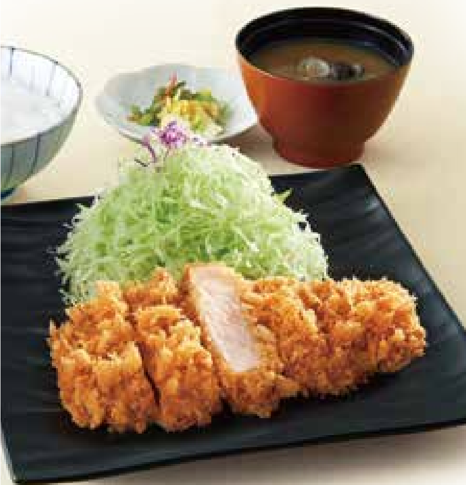
ロースかつ御飯 1,530円