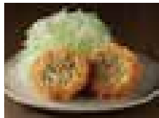
キャベツメンチかつ 300円