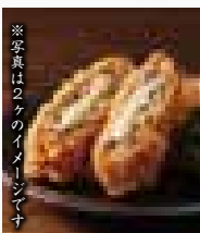
チーズ入りメンチかつ