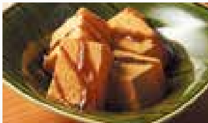
川崎大師 大谷堂 やわらかわらび餅