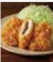
房総ハーブ鶏の梅しそかつ