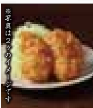
カニクリームコロッケ